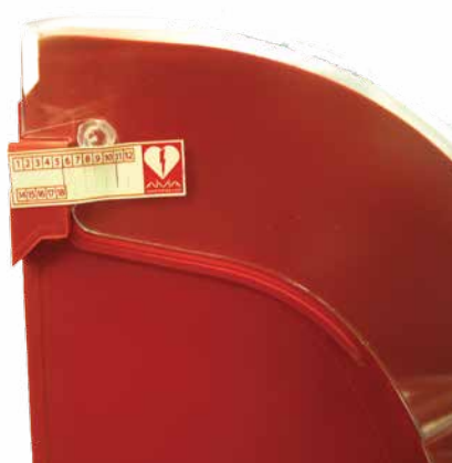
Scellés de sécurité.