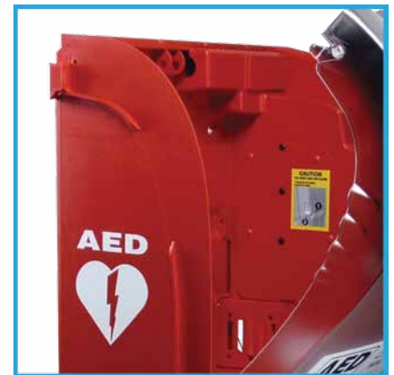
Trous de fixation murale 5/16" (8 mm).